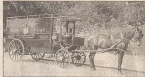
Wie alles anfing: Mit dieser originalen Pferdekutsche wurden Klaviere und Flügel von Trübger einst ausgeliefert. Die Kunden kamen meist aus den feinen Hamburger Häusern an Elbe und Alster. Auf dem Wagen steht bereits die heutige Firmenadresse.